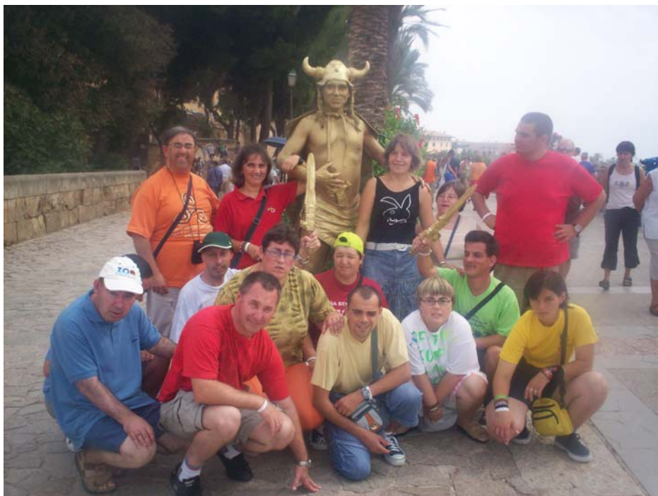
En la ciudadela de Palma con el mimo.

Una vez en la cubierta del barco el guía nos fue explicando con el micrófono el nombre de cuatro playas y nos enseñó los yates que estaban en puerto de Palma de Mallorca incluido el Fortuna, que es el Yate del Rey. También vimos el palacio de Marivent residencia de verano de la Familia Real española.