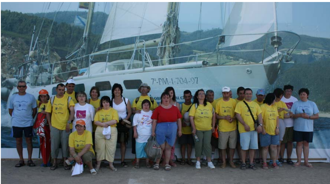
El grupo que fue a Valencia

El ultimo día de estancia en Valencia, después de cenar, fuimos a buscar la maleta para venir de vuelta para casa. Dormimos en el autobús de Autos Rodríguez de Ribadeo y paramos a desayunamos en Astorga. Finalmente llegamos a casa.