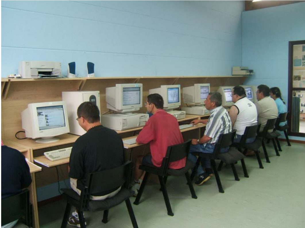
El grupo de Informática elaborando el periódico.