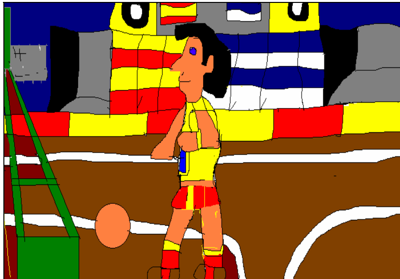
Dibujo de Ramón

El último campeonato al que fuimos fue en Pravia y era un campeonato de natación. Ganamos muchos premios y trajimos muchos trofeos. La comida también nos la dieron allí, solo llevamos algo de dinero para tomar algo.